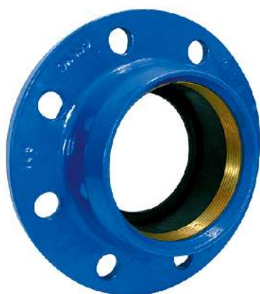
FACILE R (z pierścieniem)