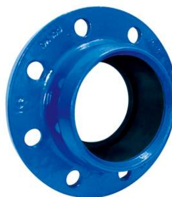
FACILE PVC (bez pierścienia)